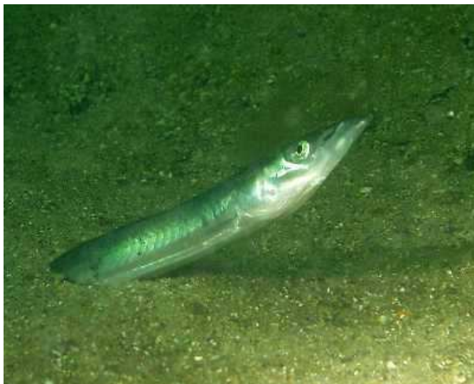
Lançon, caractéristique des sables dunaires

D'autre part, le site présente, à une échelle plus réduite, un secteur particulier, constitué de roches et de sables graveleux. Il s'agit du secteur des Ridens de Boulogne, qui constitue une entité tout à fait particulière en Manche orientale. Il s'agit d'un haut-fond rocheux, le seul dans cette zone géographique. A cette structure géomorphologique remarquable s'ajoutent des conditions hydrologiques (salinité très stable et faible amplitude de variation de température) et hydrodynamiques particulières pour la région. Ce massif, selon l'observation des pêcheurs, des plongeurs et des scientifiques, s'ensable fortement.