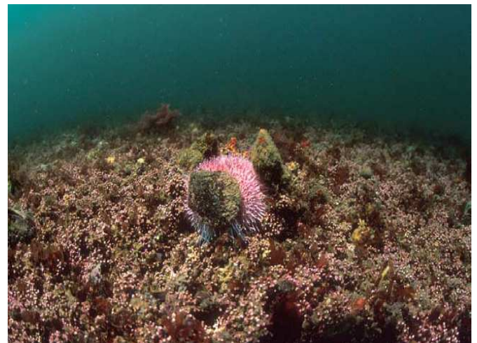
Banc de maërl

fonds meubles infralittoraux. Ces algues, aux formes très découpées, forment un réseau complexe dans lequel une multitude d'organismes trouve abri et nourriture. On y trouve près de 60 espèces de macroalgues, plus de 160 espèces d'annélides et 130 espèces de mollusques ou de crustacés. La biodiversité de l'habitat créé par le maërl est proportionnelle à la complexité de sa structure, qui permet aux organismes de toutes tailles de circuler dans ses galeries, de se blottir dans ses cavités ou de creuser ce substrat meuble.