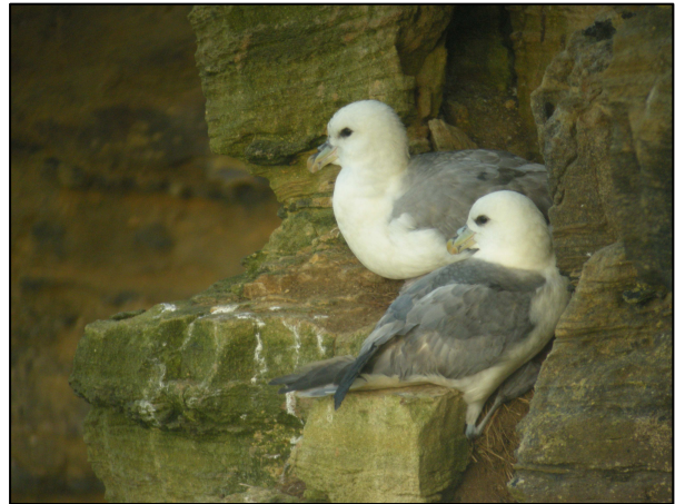
Figure 2 : Mouette tridactyle et fulmar boréal nicheurs sur la ZPS.