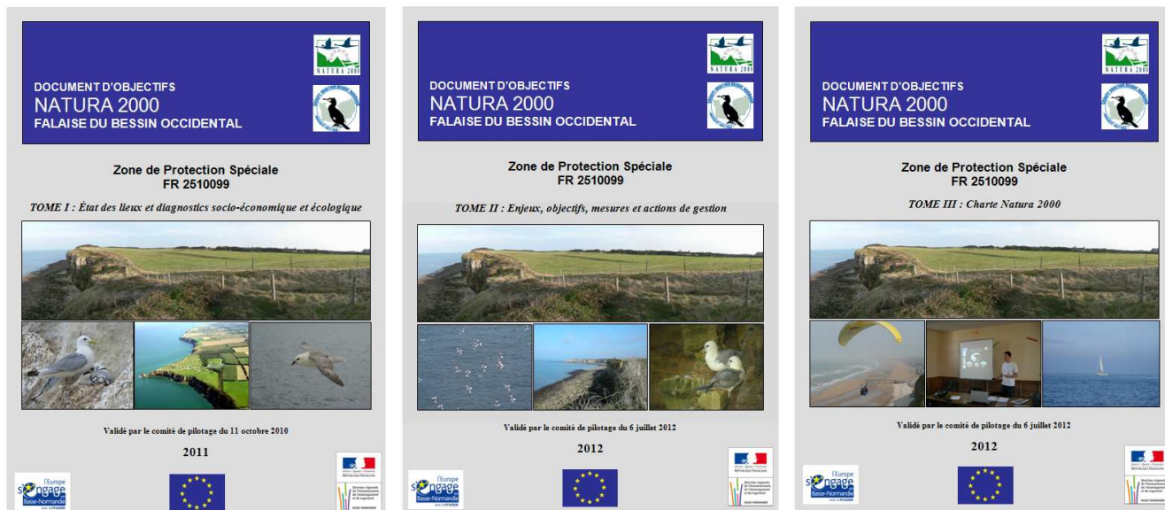
Figure 1 : Les trois tomes du DOCOB.

Le DOCOB est constitué de trois tomes. Le premier est intitulé « Tome 1 : État des lieux et diagnostics socio-économique et écologique ». Le second a pour titre « Tome II : Enjeux, objectifs et mesures de gestion ». La charte Natura 2000 du site figure dans le troisième Tome.