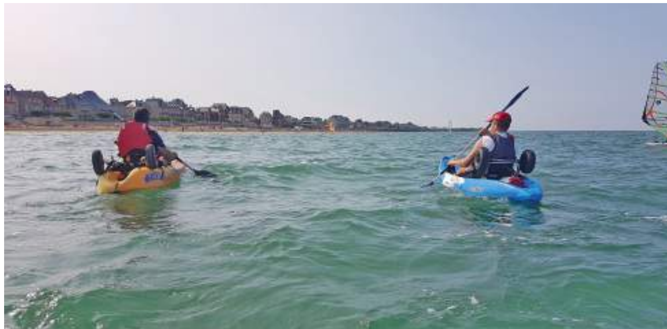
Fabrice Théréze/DREAL Normandie