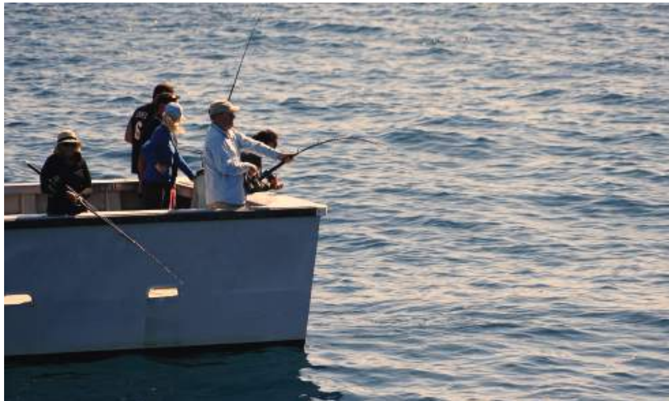
Pêche en mer