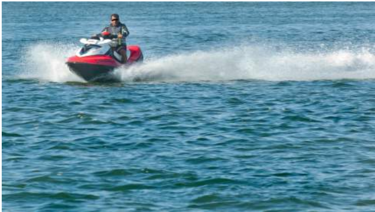
Scooter des mers