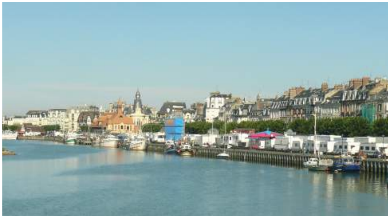
Valérie Guyot/DREAL Normandie