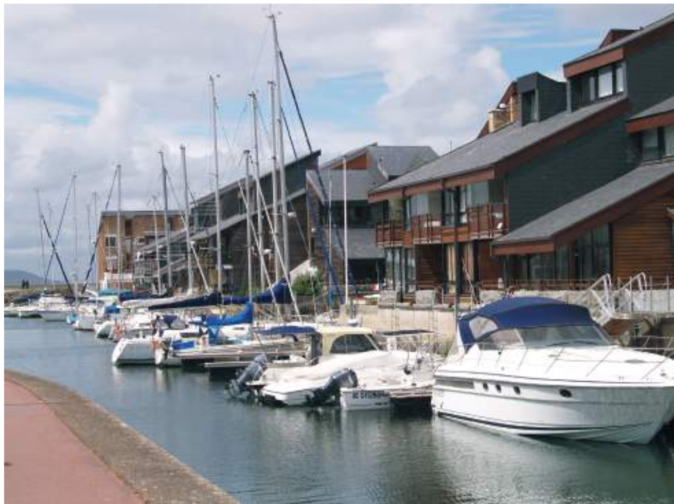
Deauville Port, intérieur de la marina