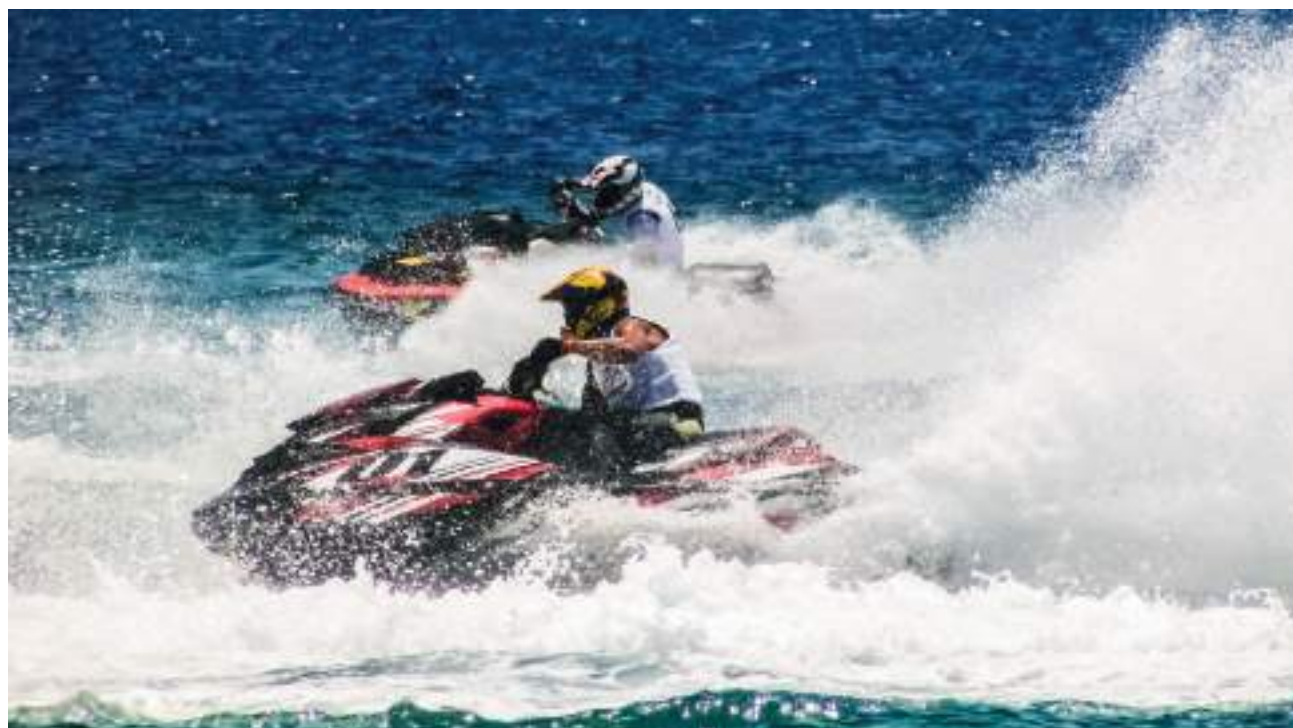
Course de jetski