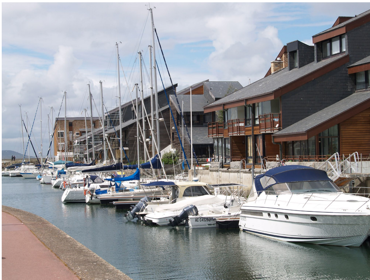
Deauville Port, intérieur de la marina