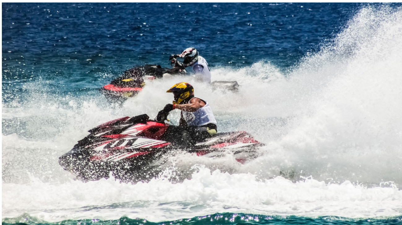
Course de jetski