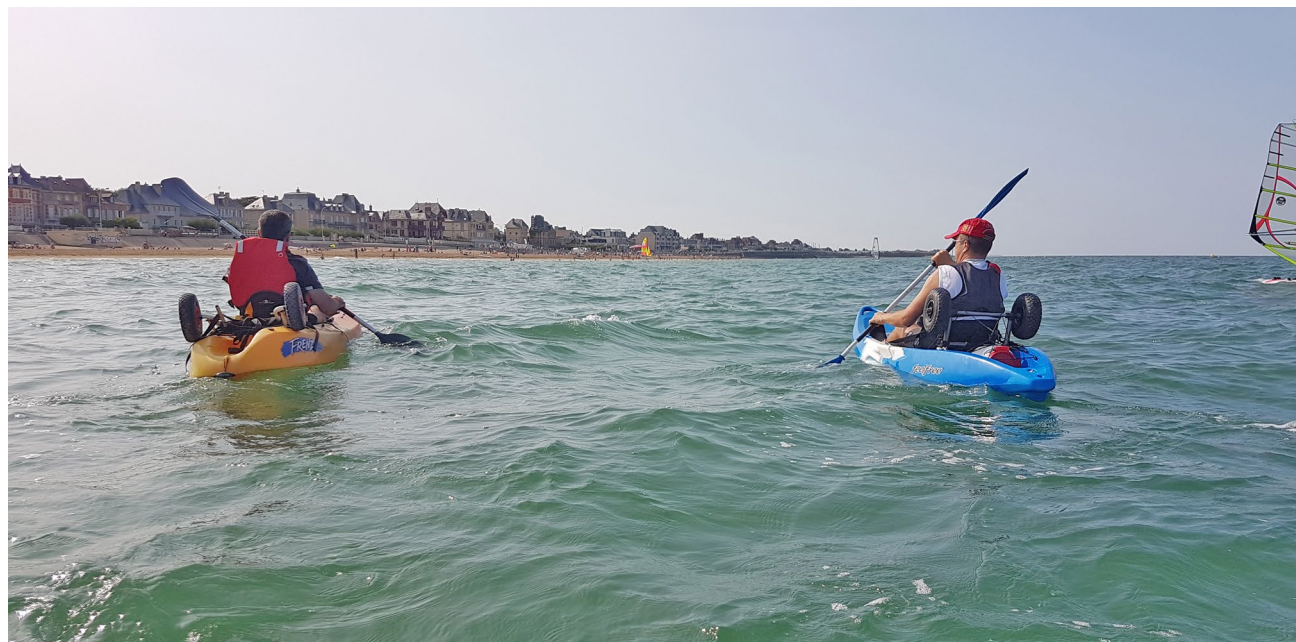
Kayak de mer