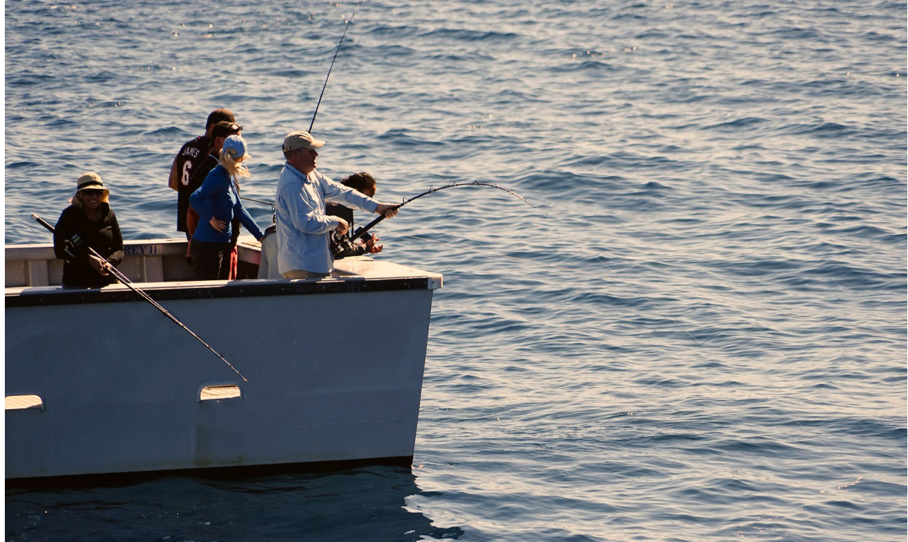
Pêche en mer