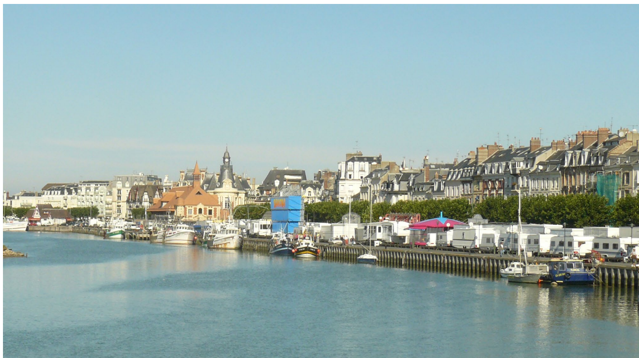
Bateaux de pêche dans le port de Deauville-Trouville